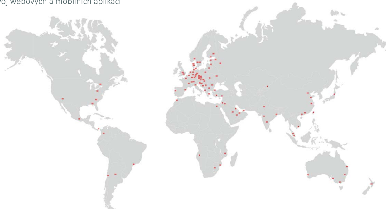
Mapa výrobních závodů a obchodních poboček skupiny ACO